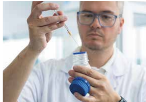
Tratamientos a escala nanométrica en pre pintura de aluminio y de acero.

En base a la observación constante, nuestro equipo de I+D logra estar a la par de la evolución de las necesidades del mercado. Estamos atentos a las nuevas tendencias y a las mejoras continuas que aplican nuestros clientes, lo que nos permite ser un socio confiable que se adapta rápidamente a los cambios.